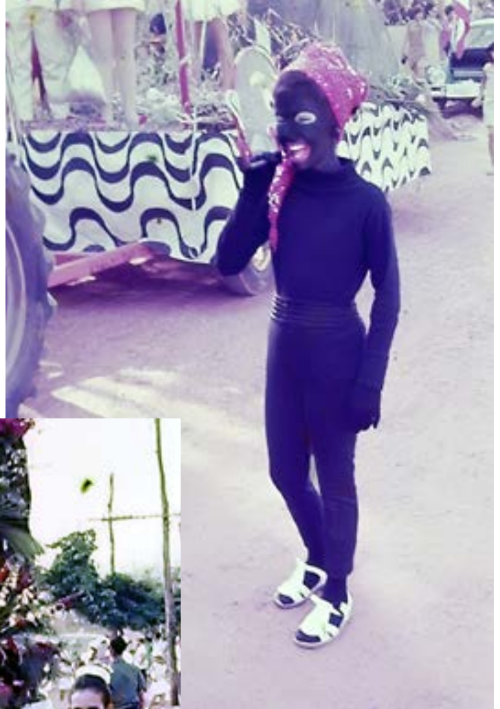
Primeiro Saci do FEFOL