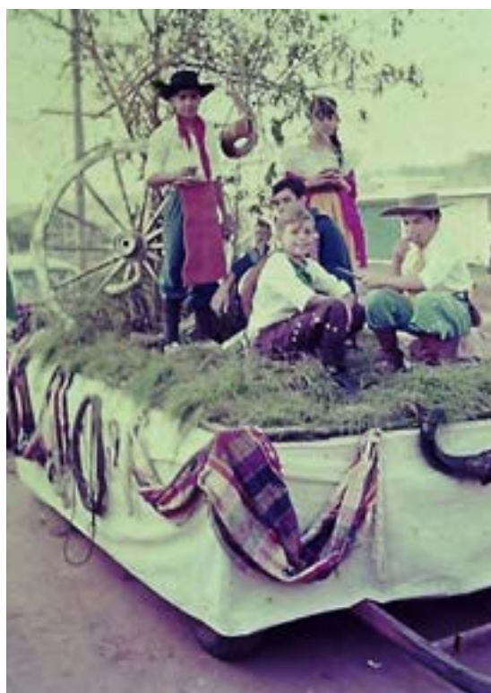
Desfile parafolclórico - gaúchos