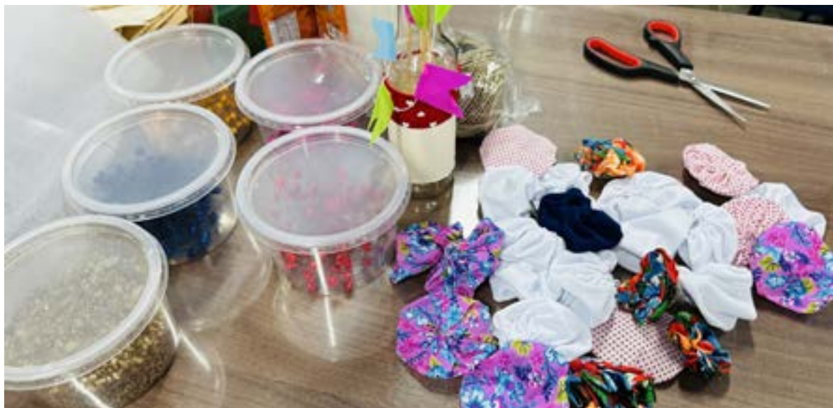
Confecções Adereços e Mimos Educação

E então, finalmente, chega o momento tão aguardado: a abertura do Festival Nacional do Folclore. Não estamos apenas assistindo a um espetáculo; estamos celebrando todo o esforço e dedicação que mantêm nossas tradições culturais. O palco se ilumina, as cortinas se abrem, e o público é transportado para um mundo de tradição e beleza, onde a alma de um povo é revelada em toda a sua glória. O público, maravilhado, testemunha a riqueza e a diversidade cultural que o festival tem a oferecer. A energia contagiante dos participantes e a beleza das tradições folclóricas preenchem o ambiente, fazendo valer cada momento de preparação.”