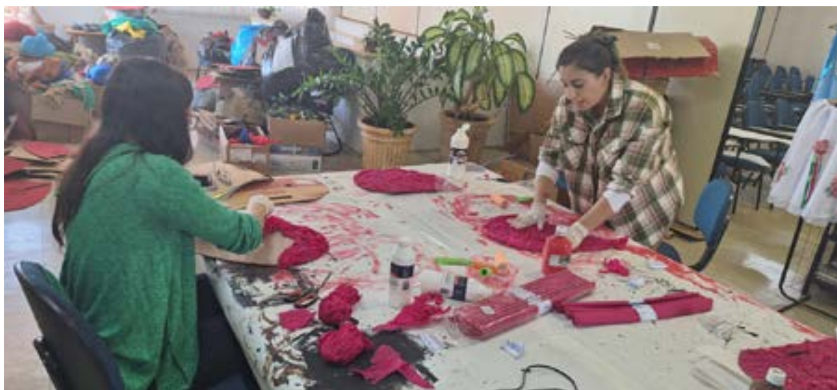
Confecção Adereços e Estudos Professores

“A experiência minha sobre a cultura do Folclore em Olímpia foi bem diferente, apesar de conhecer muitos assuntos, de gostar e respeitar a cultura do nosso país, nos meus anos de Magistério, nunca havia vivenciado o Folclore como vivencio hoje. Além de ampliar meu conhecimento a respeito de danças e histórias, o Folclore faz parte da Educação de Olímpia. Para mim, é algo muito bom, pois vejo que a cada ano que passa, devido aos avanços tecnológicos, as crianças perdem o contato com a cultura. Aqui as crianças até o quinto ano tem esse contato, creio que deveria ser estendido às escolas estaduais do nosso município, para fortalecer ainda mais entre os adolescentes e jovens.”