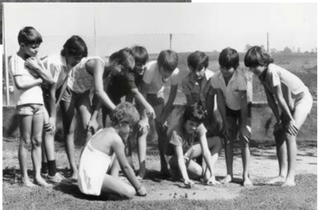
Brincadeiras tradicionais, bolinha de gude