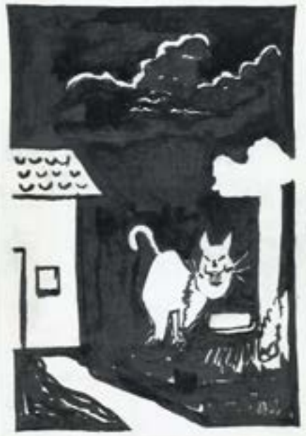
Boitata e O Gato e o Toicinho: xilografuras feitas por Willian Zanolli para os Anuários do FEFOL