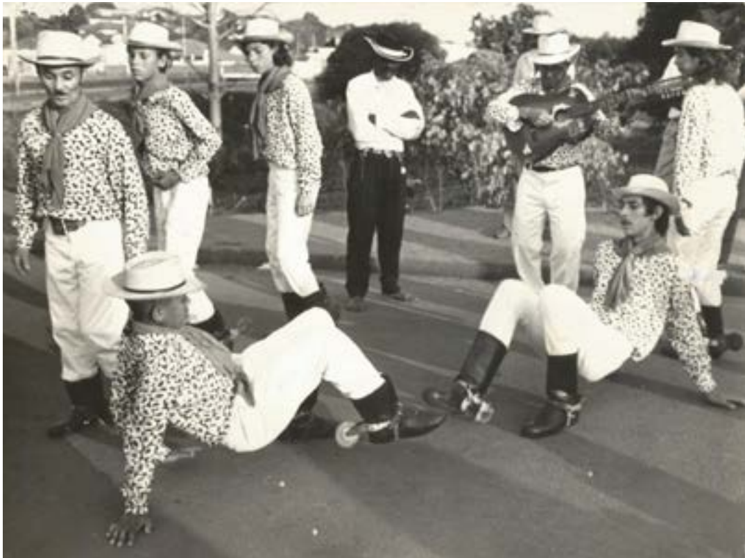
Dança da Catira