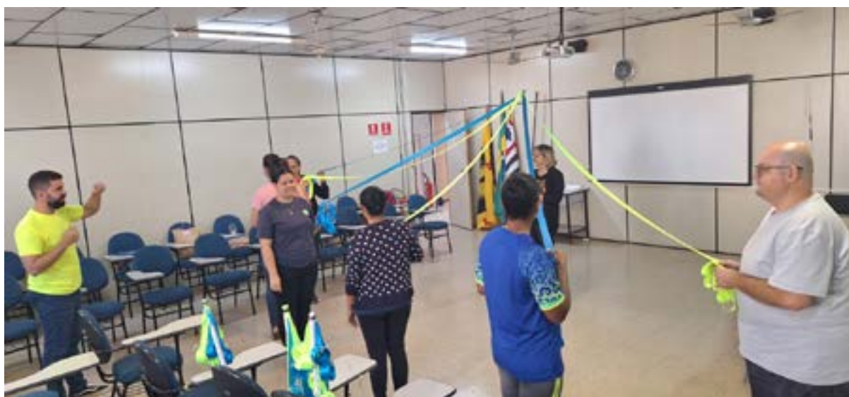
Confecção Adereços e Estudos Professores