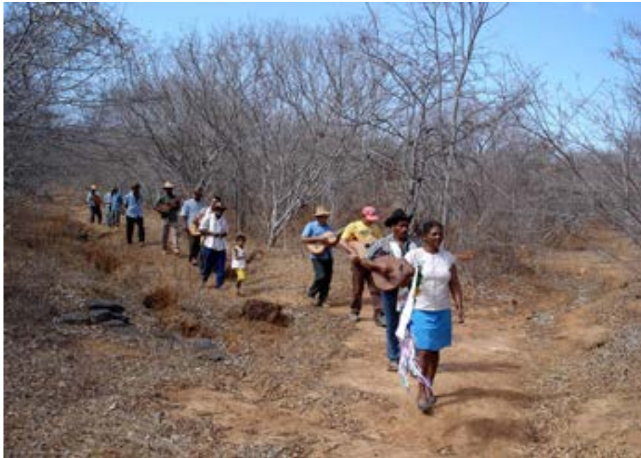
Figura 2 - Foliões durante a caminhada. Folia de Bom Jesus, agosto de 2005.

O primeiro comentário que gostaria de fazer em relação às duas figuras diz respeito à paisagem, especialmente em relação à vegetação e ao solo – verde e úmido na primeira e seco na segunda. Essa observação nos indica que estamos diante de duas folias em períodos distintos do ano. Na figura 1, temos a folia de Reis, em dezembro e janeiro, o período das chuvas (tempo das águas), quando a vegetação cresce, o ambiente se torna esverdeado e o solo umedecido. Já na figura 2, o que visualizamos é uma paisagem mais árida, com árvores ressequidas, folhas caídas, solo seco e duro e um céu limpo e azulado, típico do período da seca que se estende de abril à setembro. Ainda na figura 2, temos a caminhada dos foliões durante a folia de Bom Jesus, que acontece em agosto, no auge da seca, quando as noites são mais frias e os dias mais claros e ensolarados.