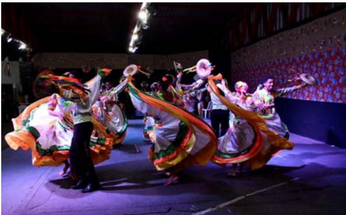
Movimento das saias, Siriri Flor de Atalaia no Mini festival, 58° FEFOL