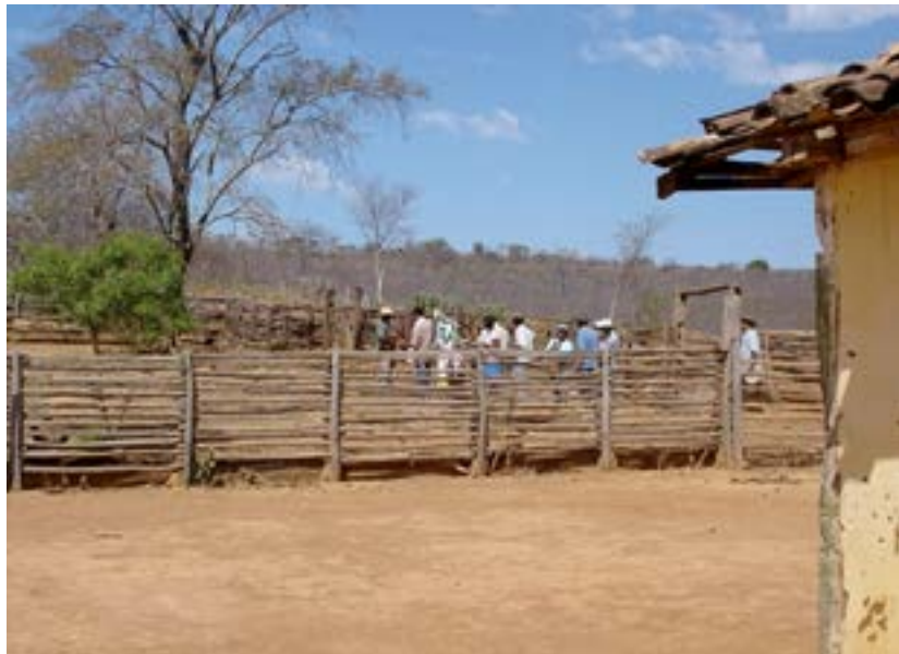
Figura 5 - Foliões afinando os instrumentos fora da casa. Folia de Bom Jesus, agosto de 2005.

Percebe-se que os foliões, até então enfileirados na caminhada, passam a habitar o espaço de outro modo. Em uma disposição circular, eles se aproximam, se reúnem e se posicionam um defronte ao outro. Interessante notar que enquanto alguns instrumentos permanecem silenciados (notadamente o pandeiro e a caixa) os demais se engajam ativamente no processo, como as violas, violões e a rabeca. Em alguns casos, a afinação vai ocorrer a uma distância mínima da moradia, bem no limiar da porteira que dá acesso ao terreiro, como na fotografia abaixo: