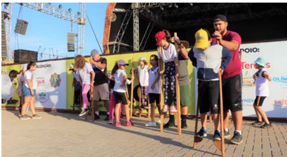
Gincana e Folcloranca

São 60 anos de história do Festival do Folclore, e, a seguir, você, leitor, fará uma viagem pelos relatos que traduzem a vivência e as memórias afetivas do folclore, colecionadas por professores, diretores de escola, supervisores e funcionários. Recortes que representam toda a Rede Municipal de Ensino de Olímpia, num trabalho que une mais de 6 mil alunos e servidores num mesmo propósito, o de preservar um legado de mais de meio século de amor pelo folclore brasileiro.