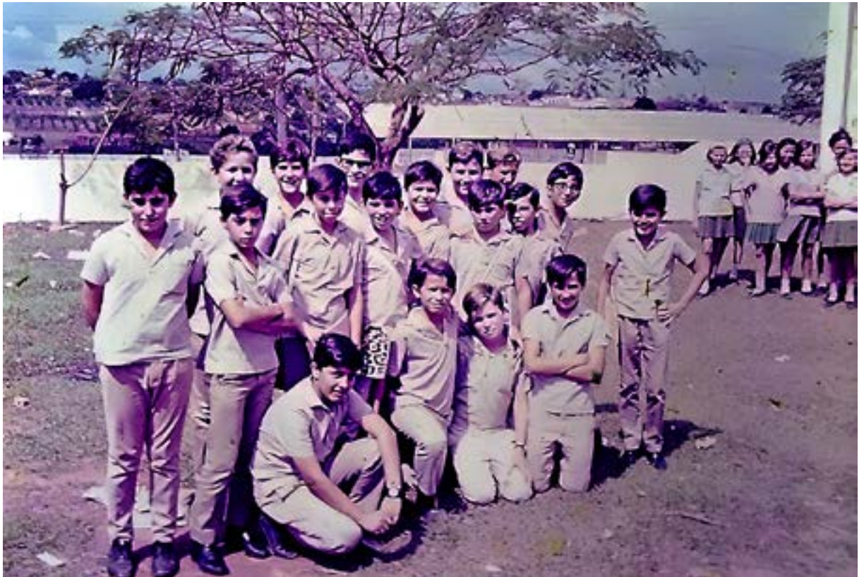
Alunos da escola Capitão Narciso Bertolino