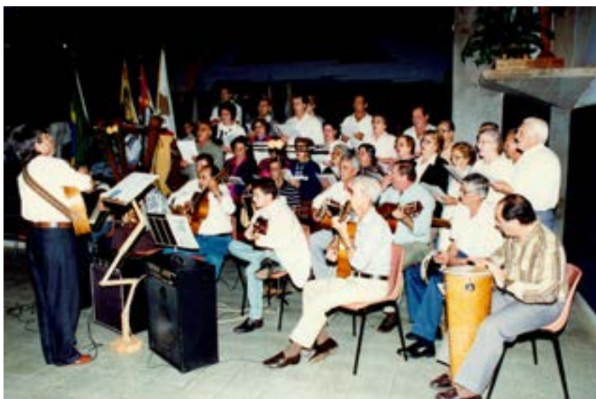
Missa dos violeiros