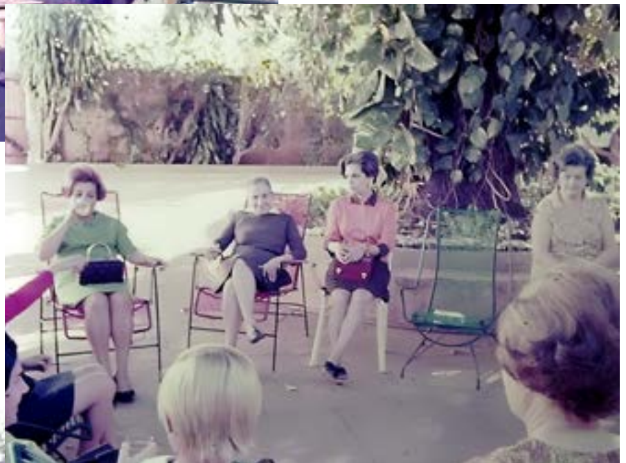
Colaboradores do FEFOL