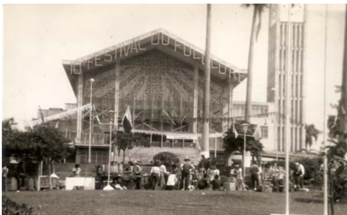
Praça da Matriz no 10 º FEFOL