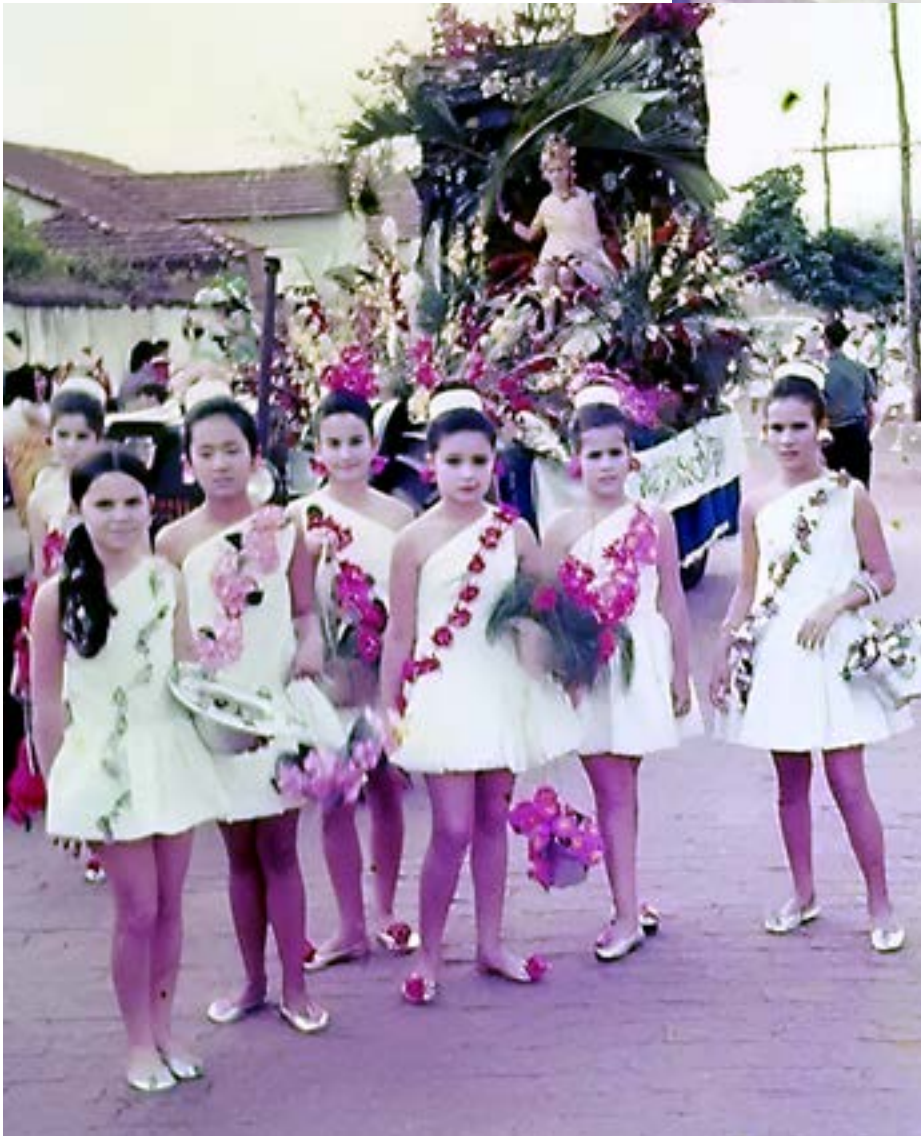
Primeiro desfile do FEFOL