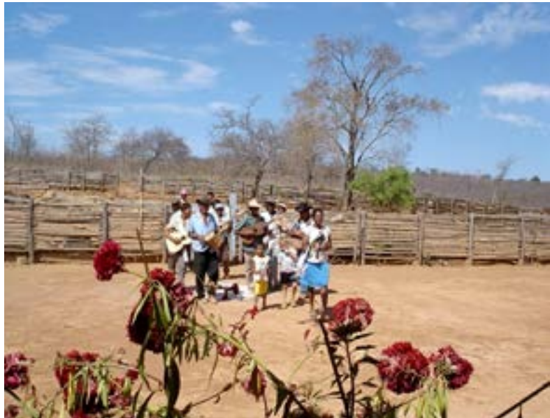
Figura 6 - Chegada à casa com a alvorada. Folia de Bom Jesus, agosto de 2005.

A entrada na casa, como se pode ver na figura 7, acontece pela porta da frente que dá acesso à sala. Nota-se que a chegada nas casas pela folia instaura uma dinâmica de movimentação bem diferente da circulação do dia a dia, que predominante acontece pelos fundos e cozinhas das casas.