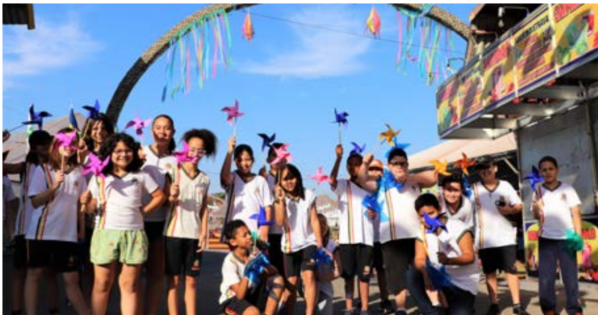
Gincana e Folcloranca