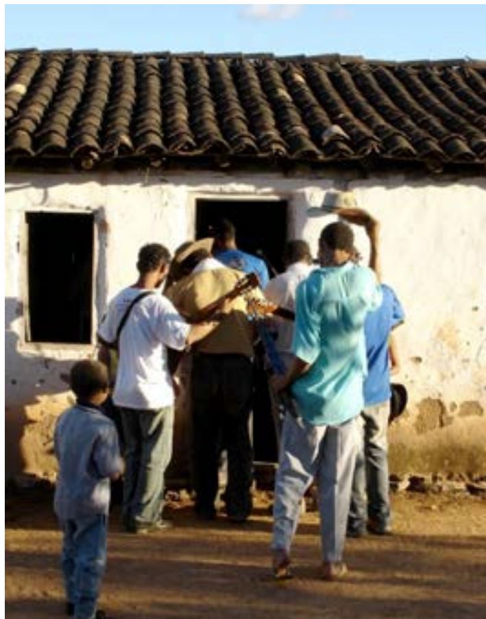
Figura 7 - Foliões entrando na casa. Folia de São José, março de 2006.

A entrada na casa, como se pode ver na figura 7, acontece pela porta da frente que dá acesso à sala. Nota-se que a chegada nas casas pela folia instaura uma dinâmica de movimentação bem diferente da circulação do dia a dia, que predominante acontece pelos fundos e cozinhas das casas.