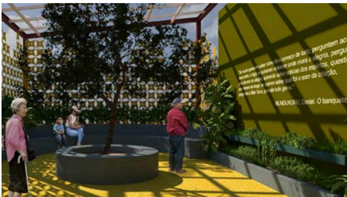
Jardim do Acolhimento

Há muitas estratégias possíveis para que os museus possam se relacionar em outras camadas com seus públicos e o novo Museu do Folclore de Olímpia tem múltiplas possibilidades de começar uma nova página na sua história a partir de outras perspectivas inter-relacionais com os seus visitantes, considerando toda a diversidade de seu próprio público.