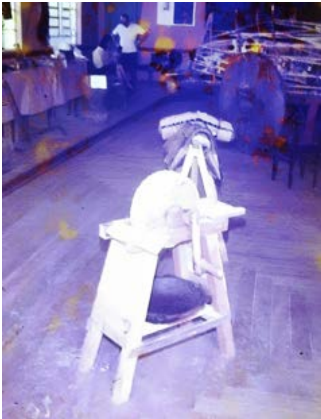
Clube Literário e Recreativo de Olímpia