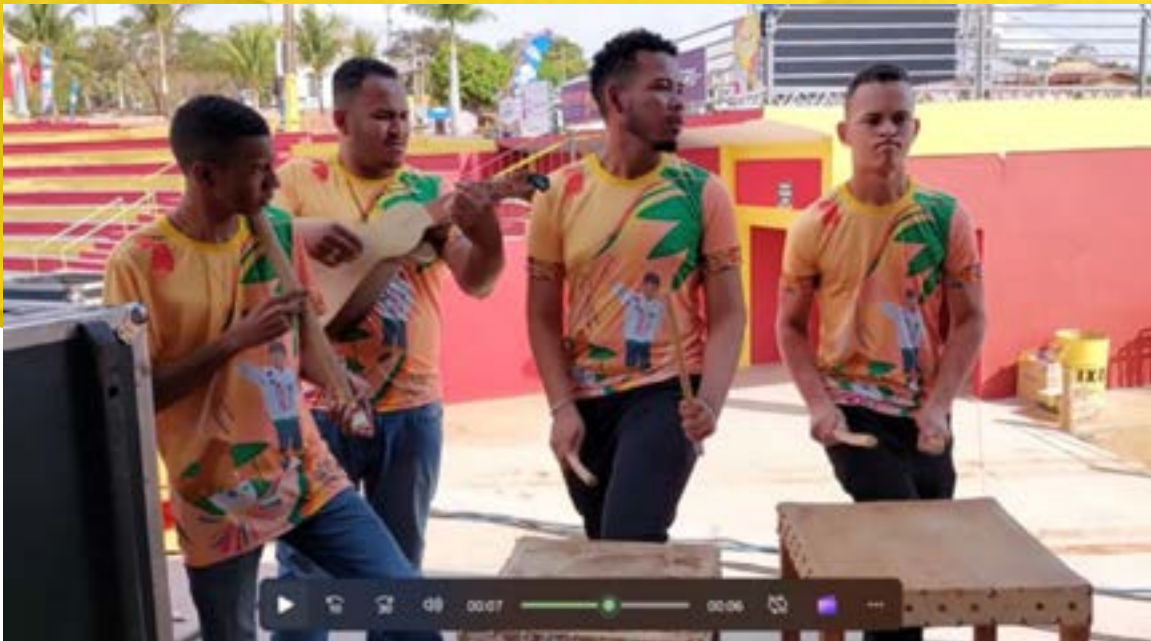
Ganzá, viola de cocho e mocho, Siriri Flor de Atalaia no 58º FEFOL