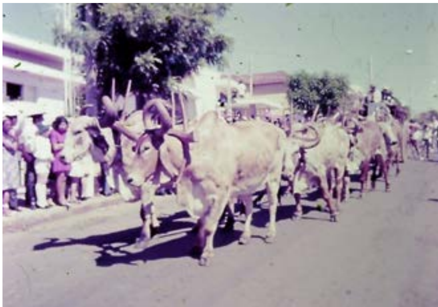
Carro de boi