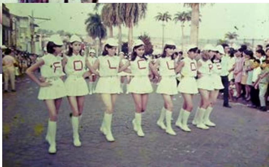
Coreografia com a frase Salve o Folclore