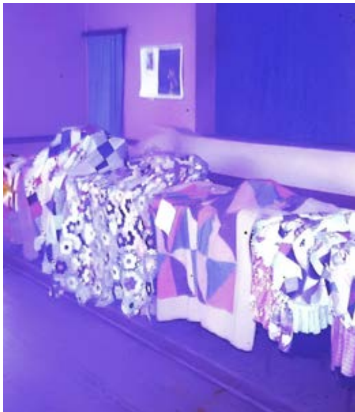
Exposição na Taba do Carajá