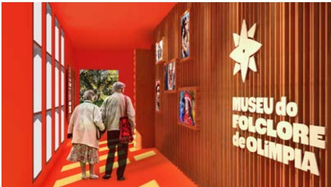
Recepção

O desafio assumido pela FRM foi conceber o novo MFO a partir de um museu que já existia, o que representava uma grande responsabilidade: a de tratar com respeito um tema rico e vasto, mantendo a essência e fazendo jus a todo o legado construído por pessoas e coletivos que contribuíram para a existência do MHFMO.