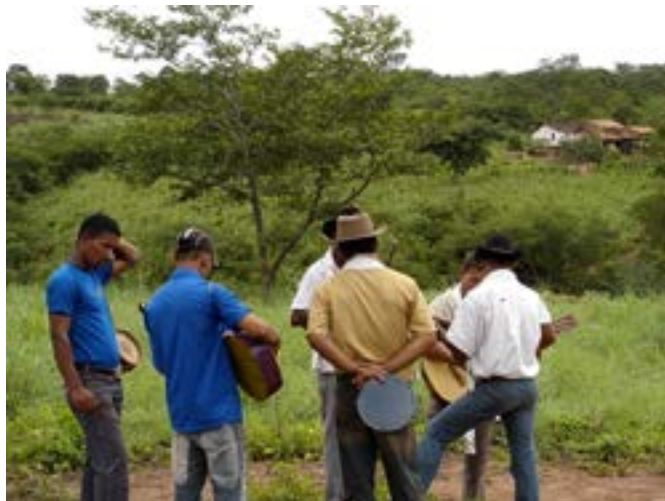
Figura 4 - Foliões afinando os instrumentos fora da casa. Folia de São José, março de 2006.

Percebe-se que os foliões, até então enfileirados na caminhada, passam a habitar o espaço de outro modo. Em uma disposição circular, eles se aproximam, se reúnem e se posicionam um defronte ao outro. Interessante notar que enquanto alguns instrumentos permanecem silenciados (notadamente o pandeiro e a caixa) os demais se engajam ativamente no processo, como as violas, violões e a rabeca. Em alguns casos, a afinação vai ocorrer a uma distância mínima da moradia, bem no limiar da porteira que dá acesso ao terreiro, como na fotografia abaixo: