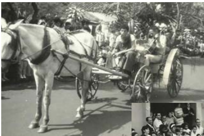
Violeiro em Charrete - defile do FEFOL