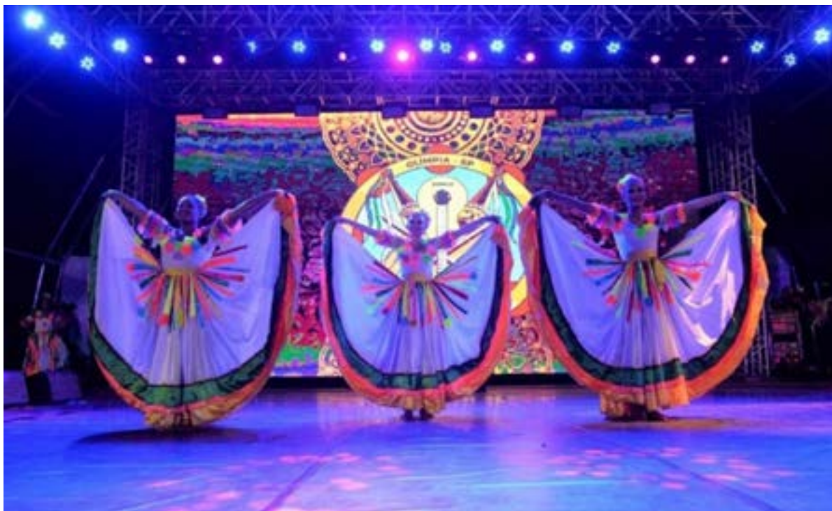
Foto 7. Siriri Flor de Atalaia no palco do 58º FEFOL