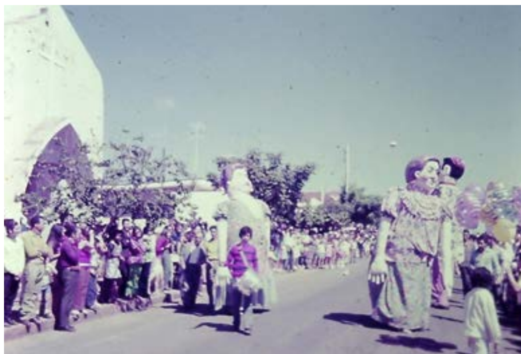
Cordão de Bichos de Tatuí