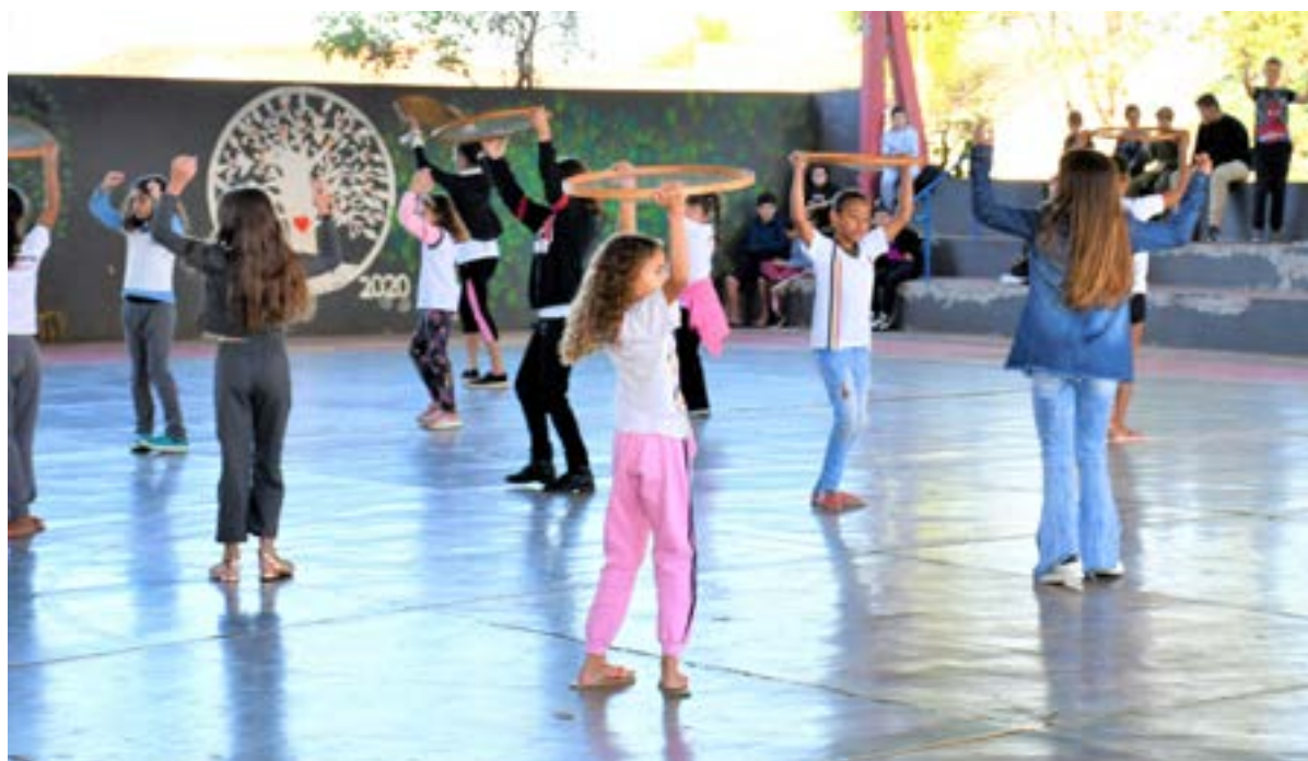
Ensaio Abertura e Confecção Educação

O Folclore em Olímpia nos bastidores é muito mais que o fervor de uma cultura, ali presenciamos a euforia por uma estrofe escrita, alegria pela roupa tomando forma em um simples retalho e até mesmo, nos recortes do papel, arrecadação de materiais que envolve toda a família, são os dedos marcados pelas costuras, recortes e colagem, percebendo nos olhos marejados que o folclore é feito por muitos.”