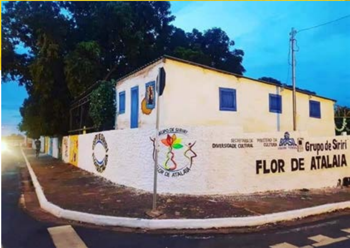
Quintal do Siriri – sede do Grupo de Siriri Flor de Atalaia

O Siriri Flor de Atalaia se apresenta em espaços variados de performance, que vão desde teatros e pequenos eventos na cidade de Cuiabá – escolas, igrejas, festas de santo, congressos, feiras, festas juninas, aniversários – até a participação em grandes festivais do Brasil e do exterior, como é o caso do Festival Internacional de Lima (Peru), Festival Internacional de Folclore de Nova Petrópolis (Rio Grande do Sul), o Festival de Danças de Joinville e o Festival do Folclore de Olímpia (São Paulo).