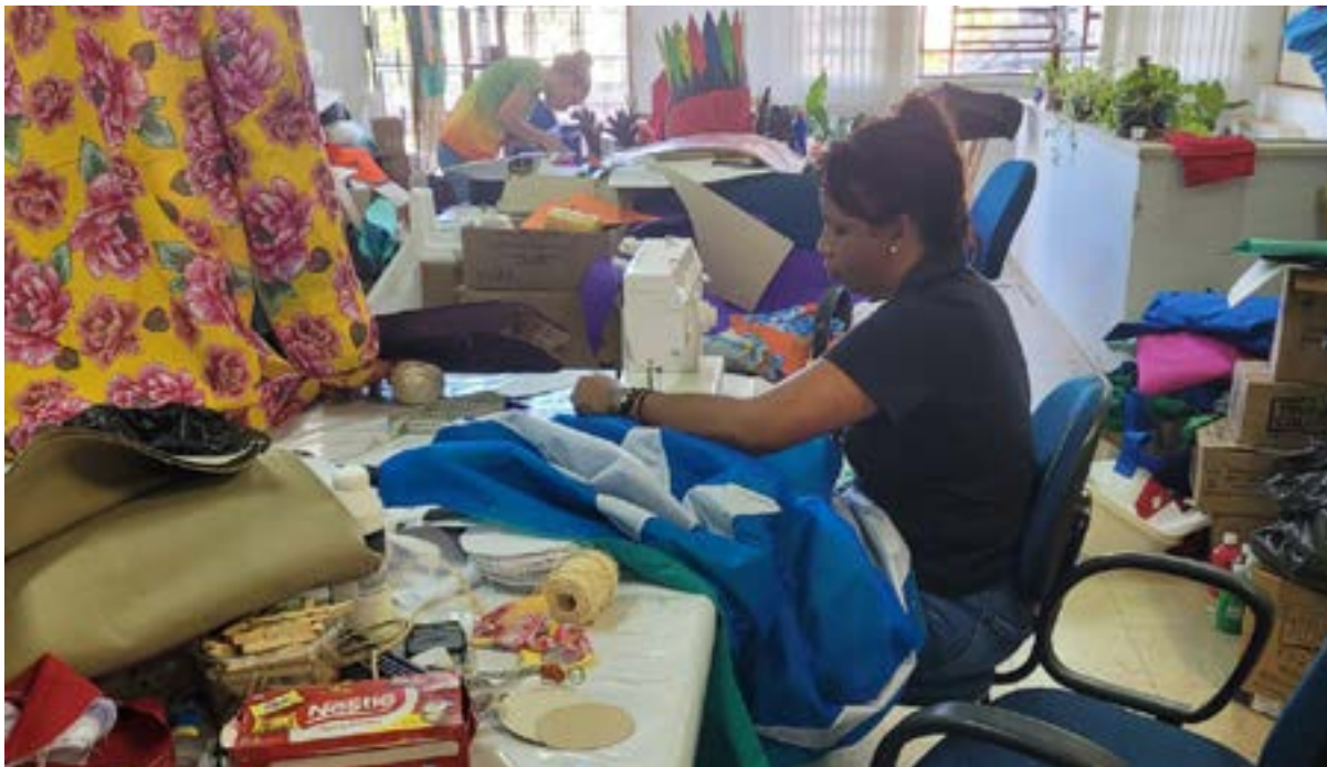
Confecção Adereços e Estudos Professores

que tudo movimenta antes do acender das luzes e antes de passar o som! Tudo, tudo, tudo que antecede o momento que vai além do palco coberto pela noite estrelada onde folcloresce, folcloresce, folcloresce coração!”