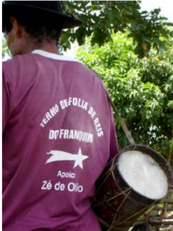
Figura 3 - Caixa de folia. Folia de Santos Reis, janeiro de 2005.

A esse conjunto de cordas devemos acrescentar a caixa que, embora seja uma percussão, é construída (e afinada) com uma corda que atravessa o corpo do instrumento, conectando o aro superior ao inferior, como na imagem abaixo: