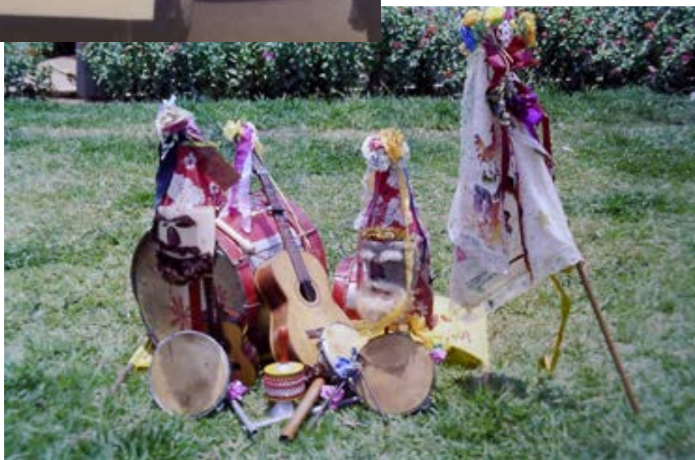
Máscaras, Bandeira e instrumentos musicais da Folia de Reis