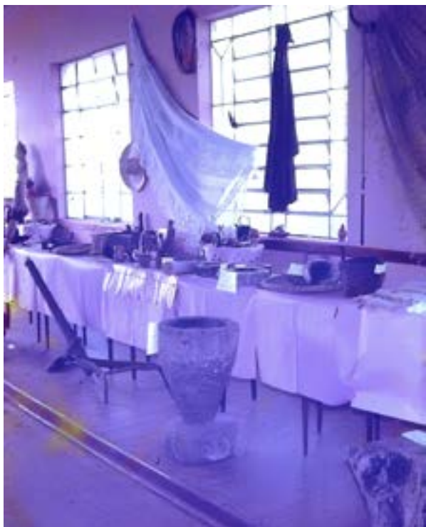
Clube Literário e Recreativo de Olímpia