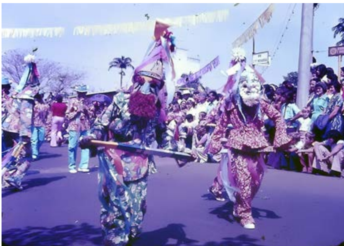
Folia de Reis Mirim, de Olímpia