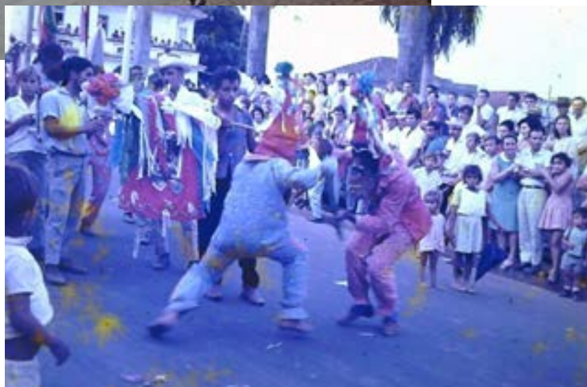
Folia de Reis - Fardados dançam no desfile do FEFOL