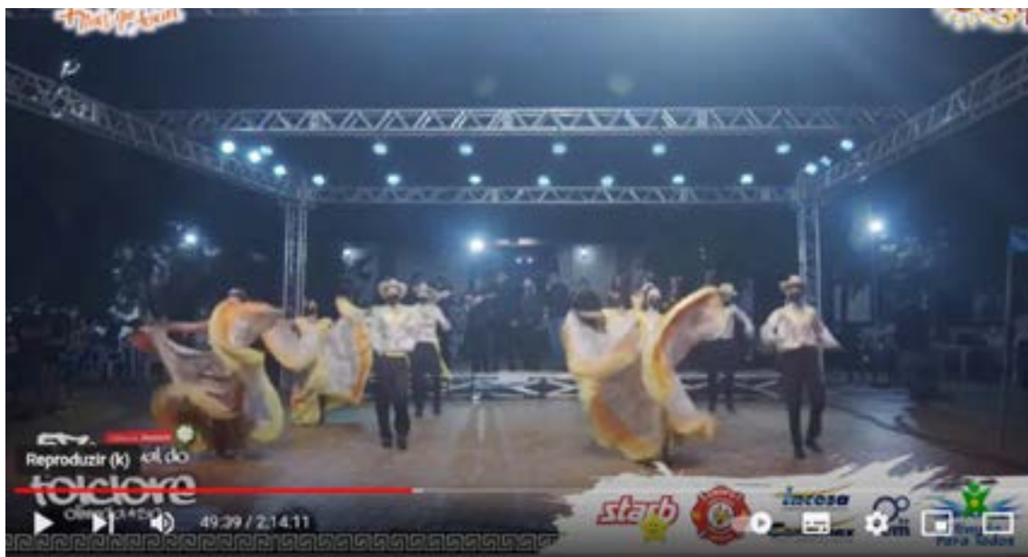
Siriri Flor de Atalaia no 57º FEFOL – Edição Híbrida 2021