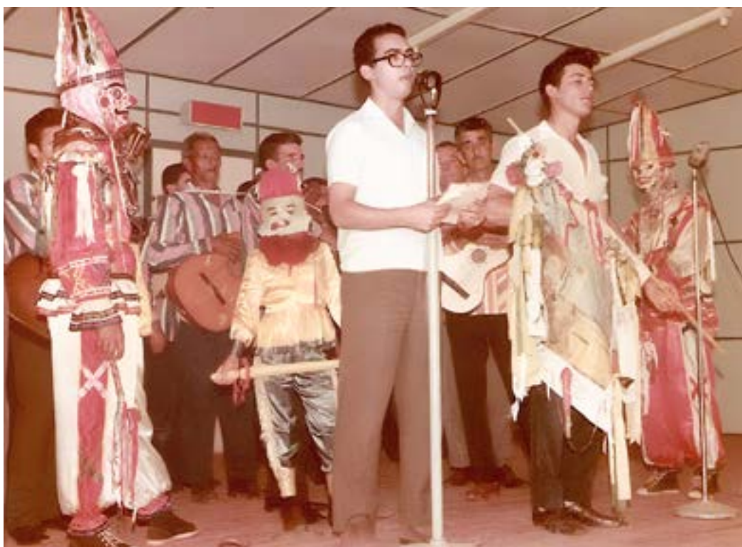
Companhia de Reis do Auditório da Rádio Difusora de Olímpia