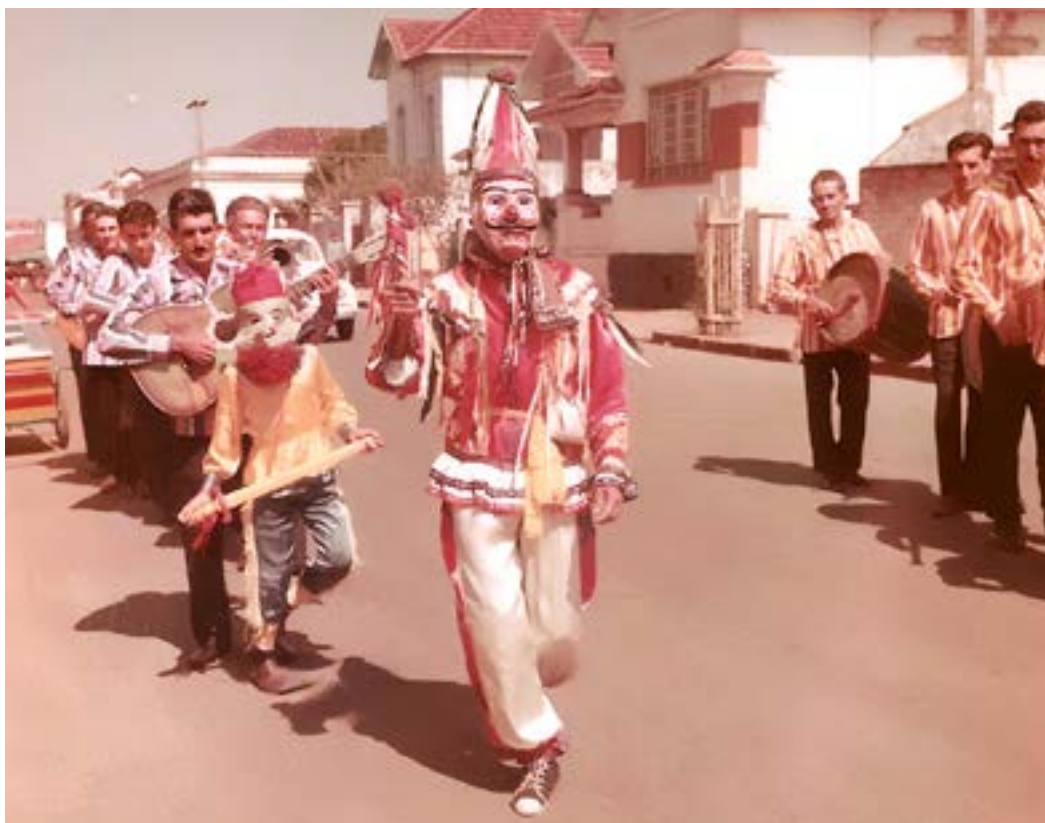
Companhia de Reis do Auditório da Rádio Difusora de Olímpia