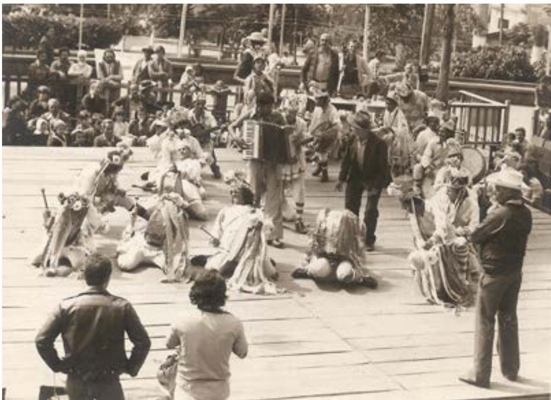
Terno de Congada de Sainha Irmãos Paiva, na Praça da Matriz