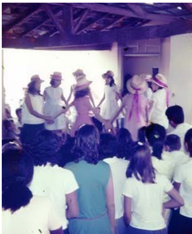
Apresentação no Colégio Olímpia