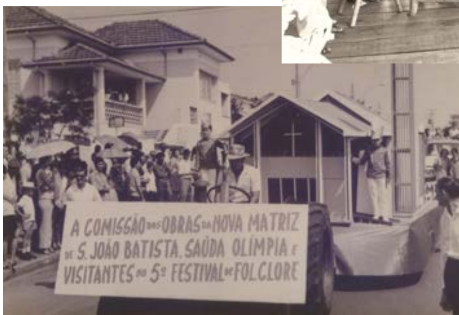
Maquete da Igreja da Matriz