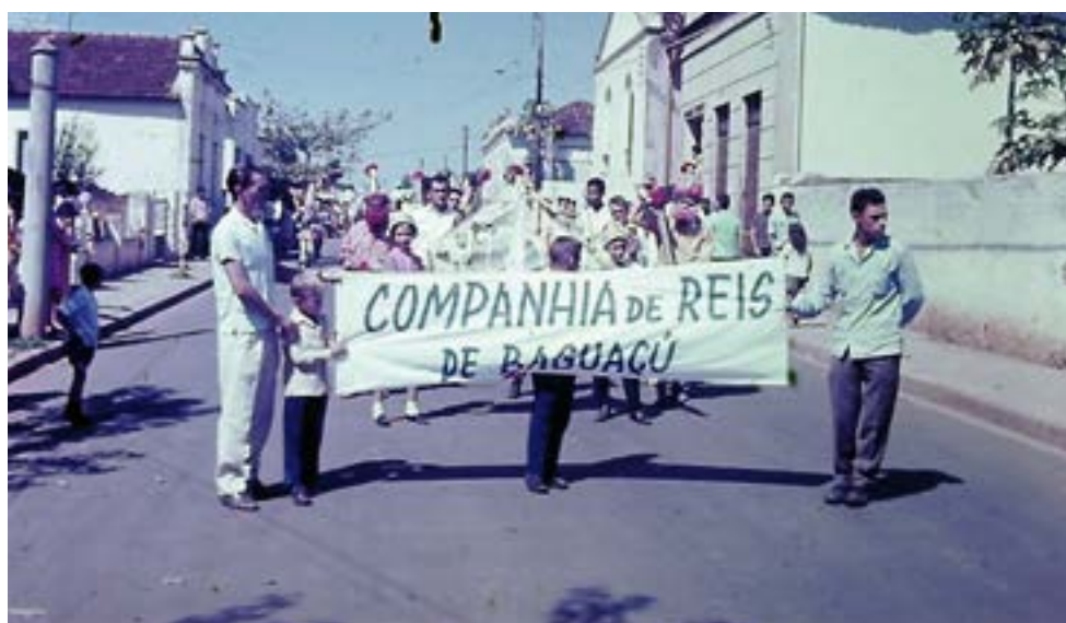
Folia de Reis de Bagaçu