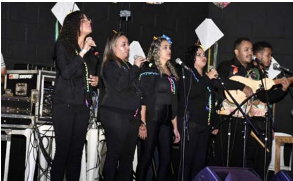
Músicos do Siriri Flor de Atalaia no palco 58º FEFOL