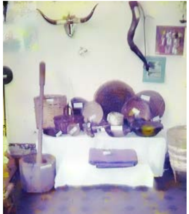
Exposição no Colégio Olímpia