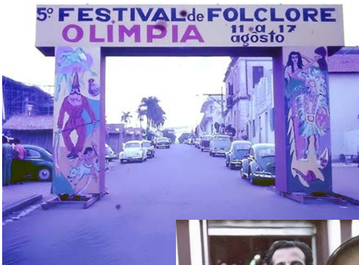
Portal do 5º Festival do Folclore de Olimpia