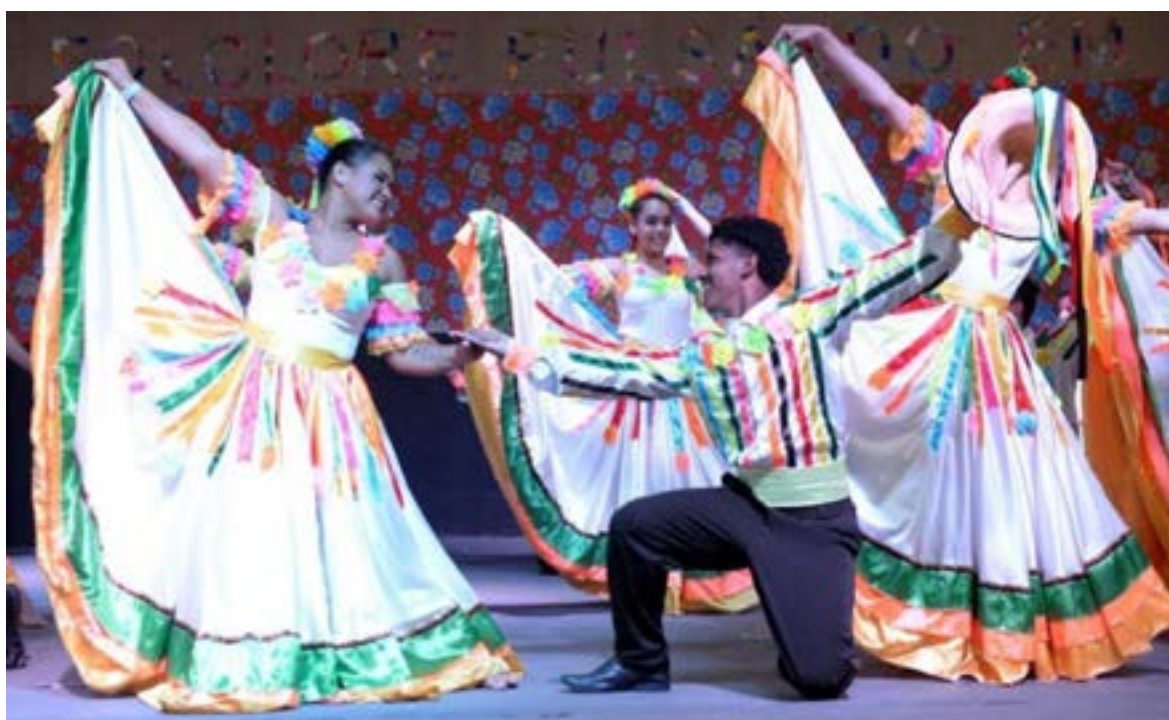
Dançarinos cortejando as damas, Siriri Flor de Atalaia no Mini festival, 58° FEFOL

A Instrumentação musical do Siriri flor de Atalaia é formada por violas de cocho, reco-reco de bambu, chamados de ganzás no siriri, o mocho, instrumento de percussão em formato de banco, sem caixa de ressonância e tocado com baquetas e por um coro de homens mulheres. O mocho produz um som seco e junto com os ganzás ditam o ritmo e o andamento da música e da dança. O canto é estruturado com frases curtas e tem a forma de pergunta e resposta.