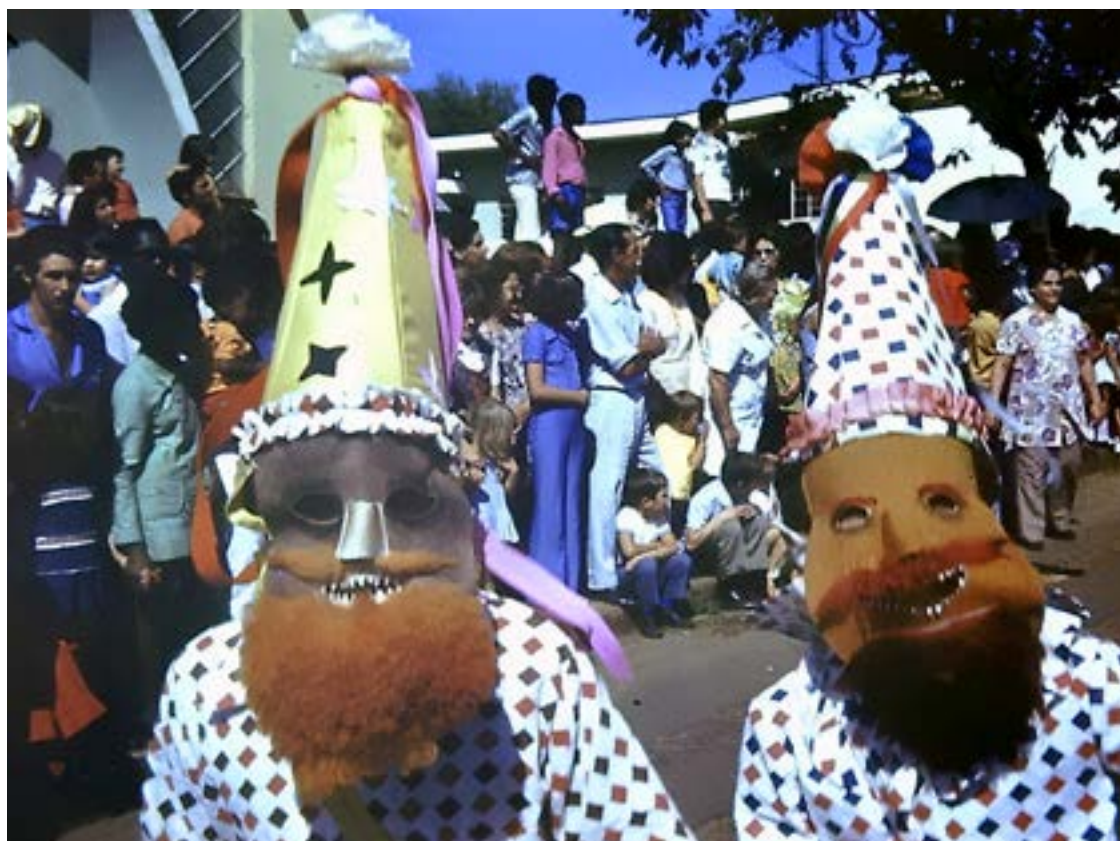
Folia de Reis no desfile do FEFOL