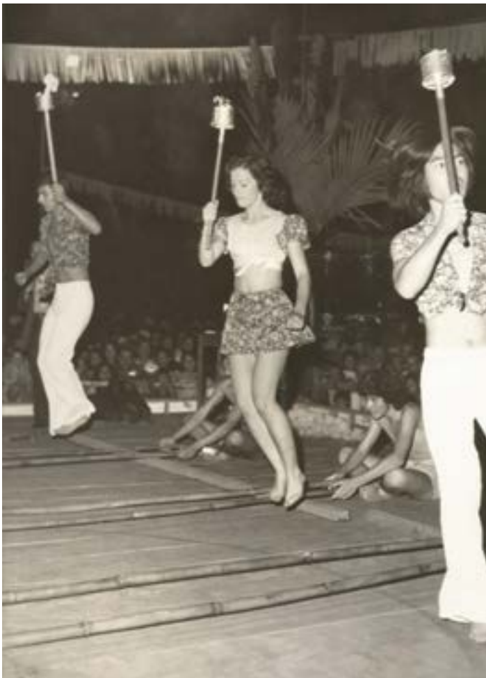
Dança do Bambu - GODAP