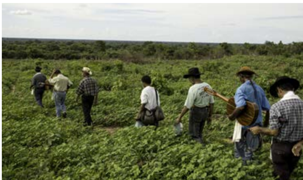
Figura 1 - Foliões durante a caminhada. Folia de Reis, janeiro de 2004.

As duas imagens a seguir retratam momentos de caminhada nas folias de Reis e Bom Jesus, respectivamente.