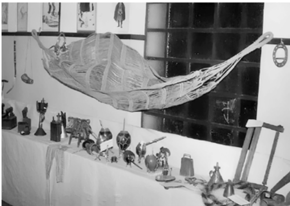
Exposição na escola Capitão Narciso Bertolino