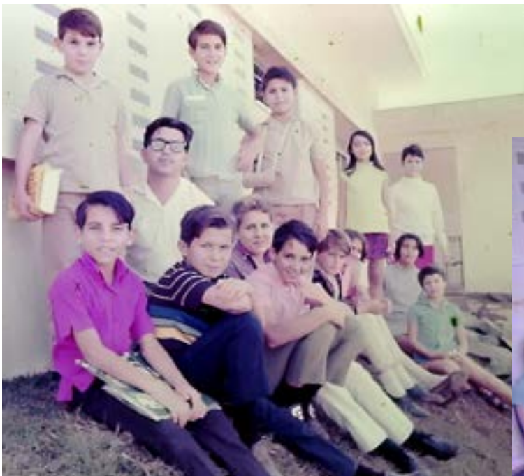
Grupo de alunos escola Capitão Narciso Bertolino, pesquisando sobre folclore