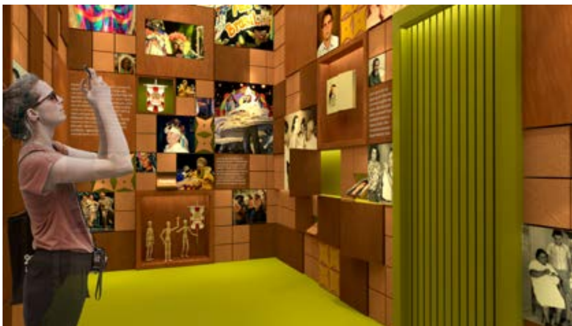
Caminho de Olímpia

Cada um dos envolvidos serviu de norte para nós. Éramos “forasteiros” conscientes, e não podíamos, nem queríamos, falar em nome dos olimpienses. Assim, sempre que o caminho desviava, esse coletivo de cidadãos apaixonados pelo folclore trazia-nos de volta a Olímpia, para que pudéssemos pensar um novo equipamento museológico, no mínimo equivalente ao apreço que a cidade e seus cidadãos têm pelas manifestações culturais populares. Assim, o projeto foi feito com muito orgulho, afeto e respeito ao pertencimento, diversidade e identidade cultural de todos que estiveram envolvidos.