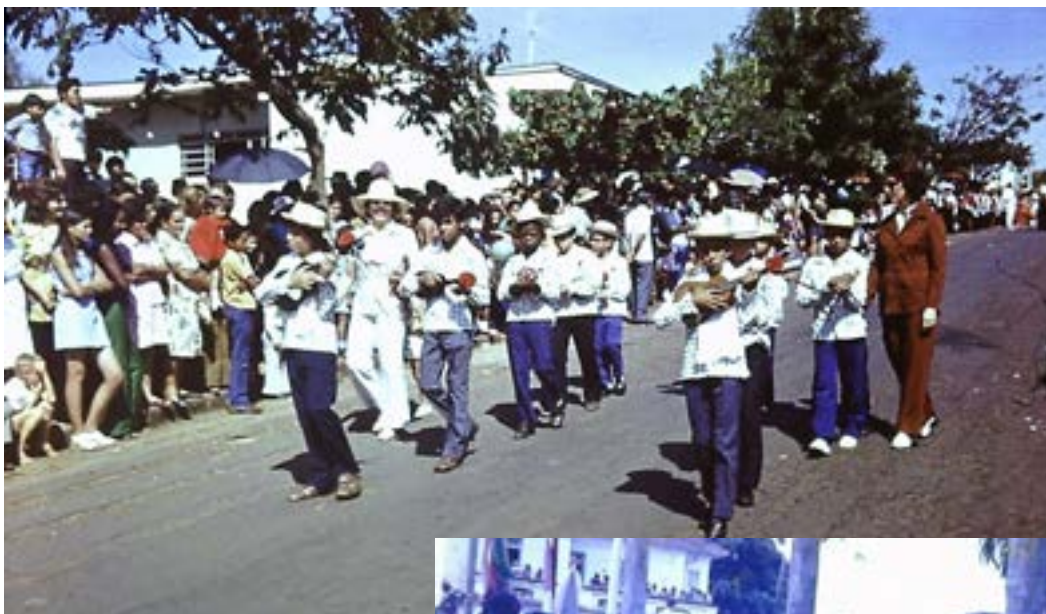
Folia de Reis Mirim