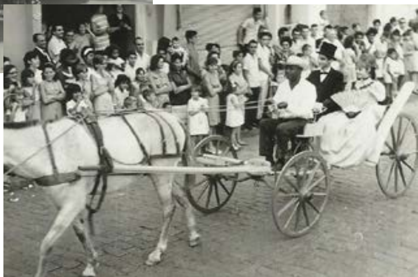
Sinhá Moça - desfile parafolclórico