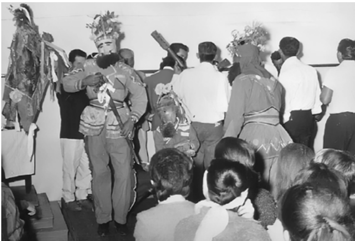
Folia de Reis na sala do Colégio Olímpia