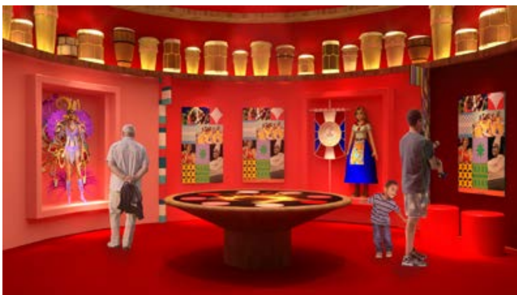
Caminho das Festas