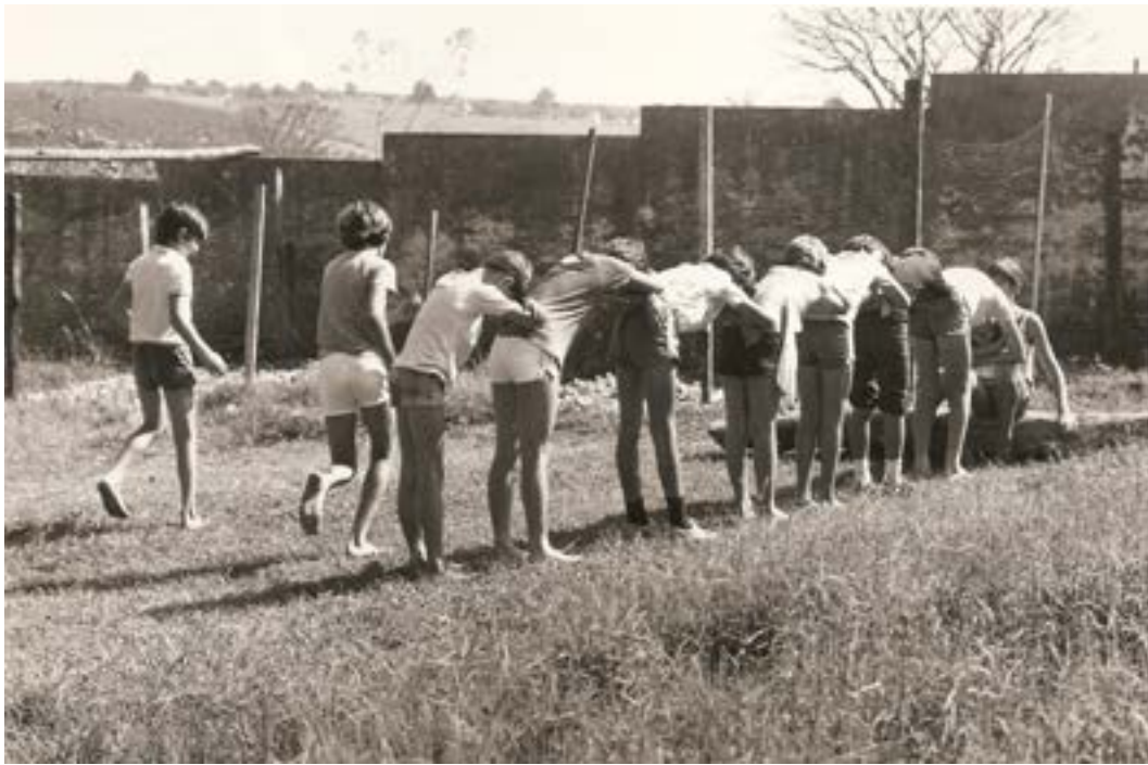
Balança caixão - brincadeira infantil