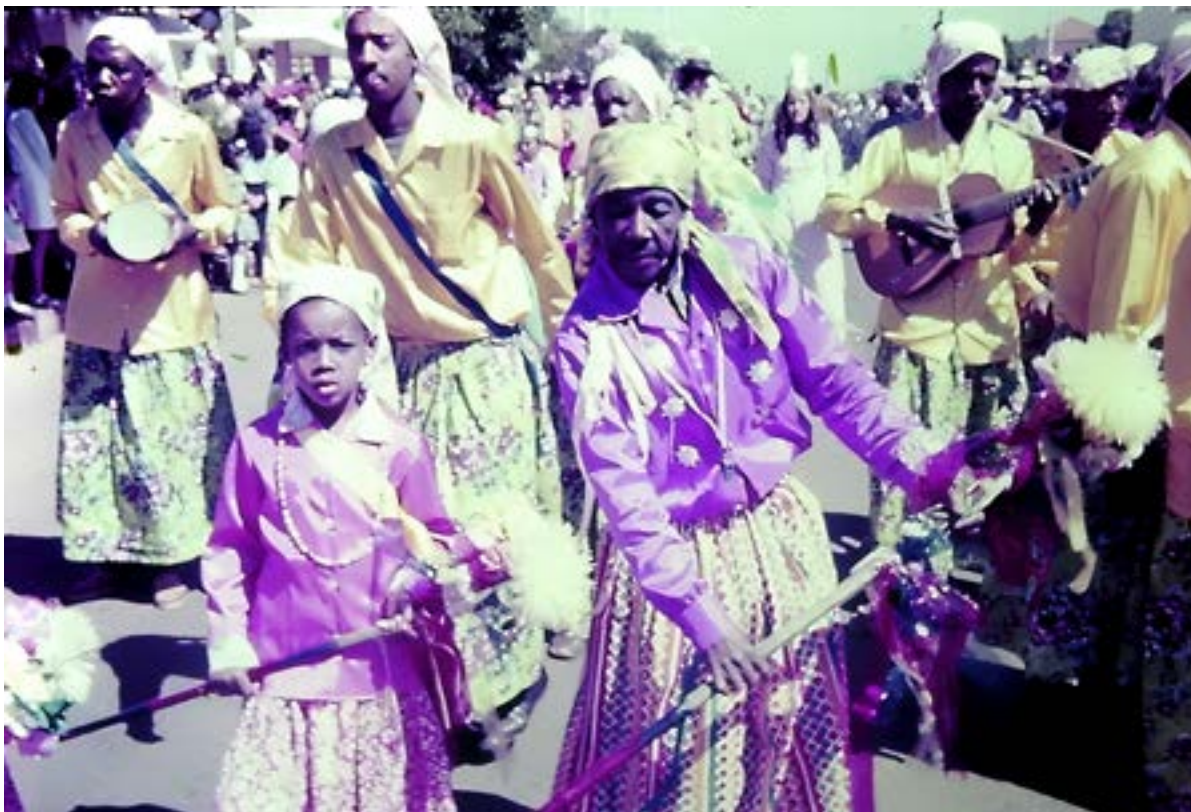
Guarda de Moçambique O Manhoso de Ibiraci